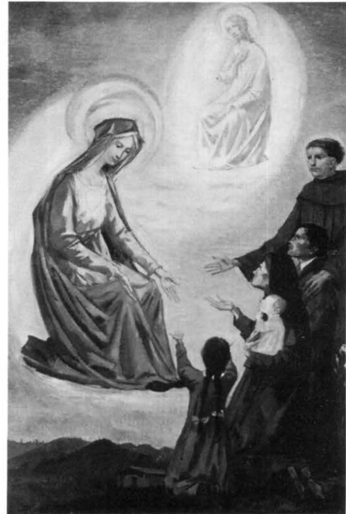
T. Longaretti, Maria mediatrice - Bergamo, Chiesa dei Francescani

Prega tu per tutti coloro che in questa comunione sono uniti a te come fratelli e sorelle redenti. Domanda per noi la grazia di essere veri cristiani: redenti e battezzati, sempre piú trasformati nella vita e nella morte di nostro Signore,