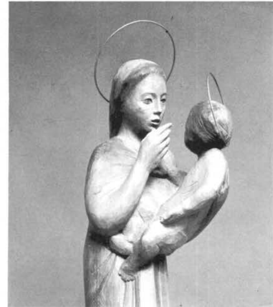
M. Baldassarri, La Vergine col Figlio

Ti affido la mia intelligenza la mia volontà, il mio cuore. Depongo nelle tue mani la mia libertà,