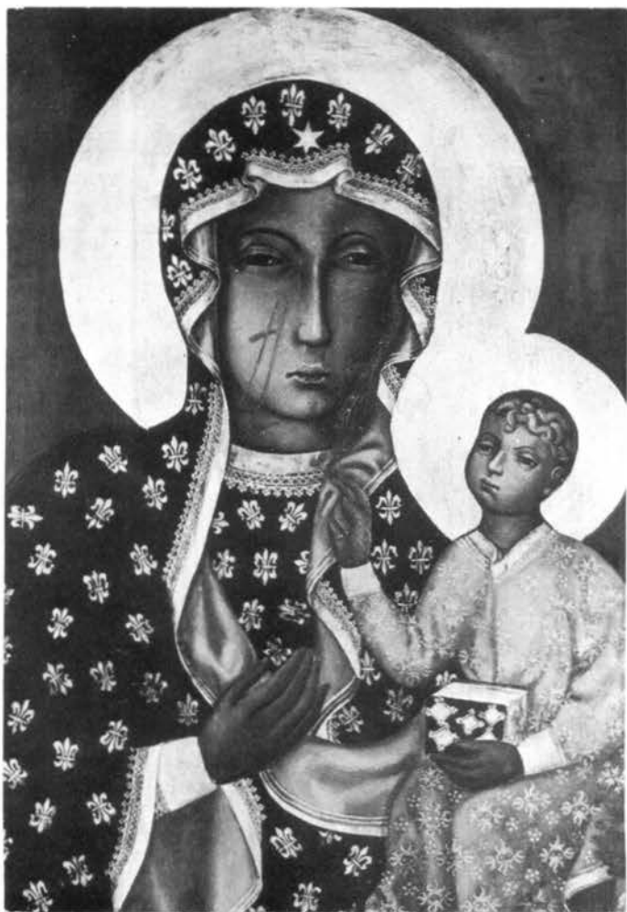
La Vergine di Czestochowa