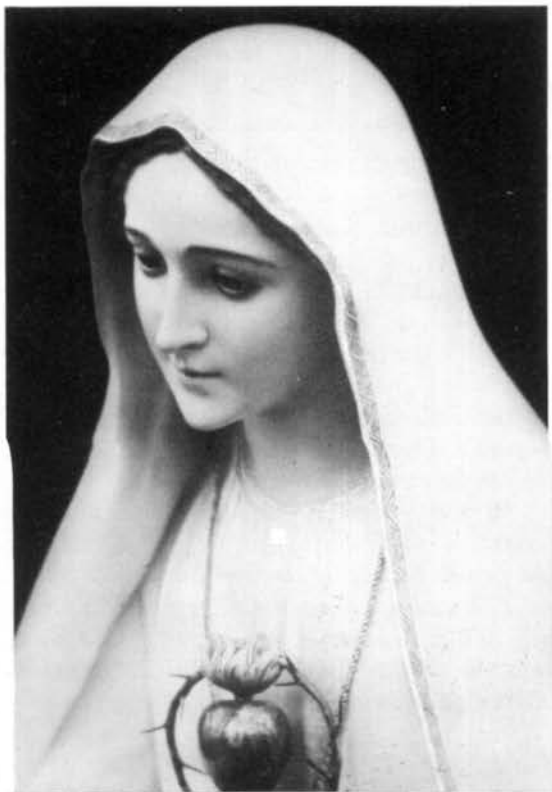
Il Cuore immacolato

Guida Perché il mondo sia liberato da ogni odio, ingiustizia e violenza,