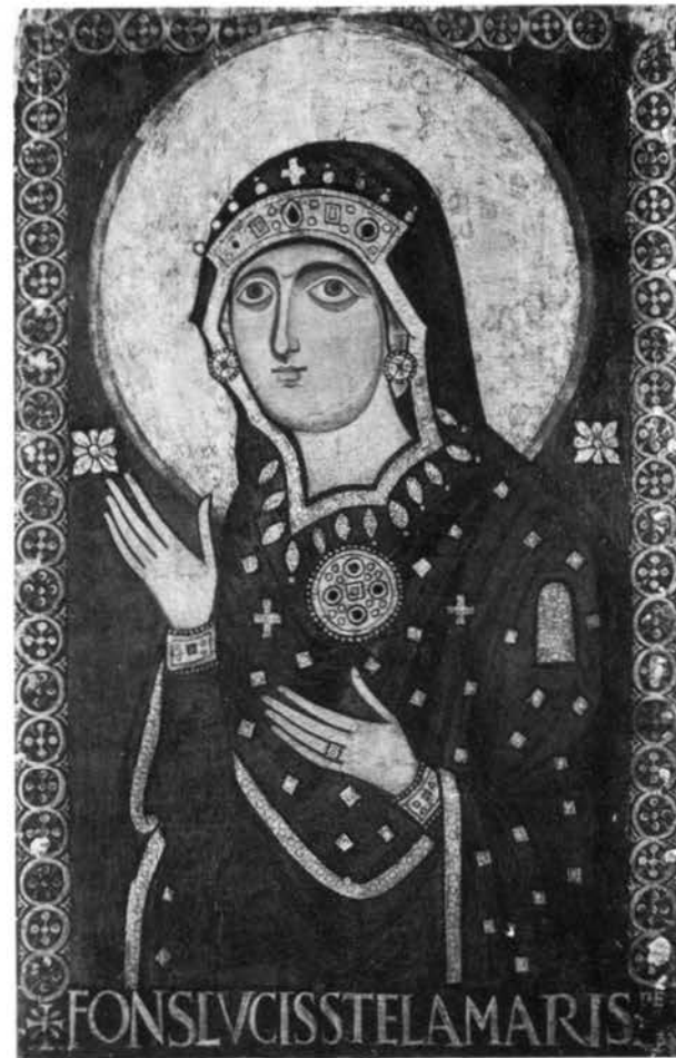
La Supplice - Roma, S. Maria in via Lata - Sec. VIII

Nel nome e a gloria della Trinità beata, che ti ha voluta Madre di Cristo Salvatore e Madre dell'umanità da salvare, consapevole della mia indegnità ma fiducioso nel tuo materno aiuto, io, che già col Battesimo sono stato immerso nel mistero di Cristo, mi pongo (oggi) interamente nelle tue mani, o Maria: per camminare con te per lavorare con te per salvare con te per portare a compimento giorno per giorno con te il mio impegno d'amore e di servizio ai fratelli, con la tua luminosità di fede con la tua evangelica testimonianza di vita con l'impeto d'Amore col quale tu ami tutti come figli, sí che anch'io li abbracci tutti nel tuo Cuore